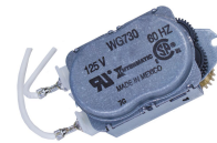
156T1950AD12 12 bolsas de disparadores 156T1950A Motor de 125 V CA, 60 Hz para las series T1900, T2000, C8800, series R8800, T1900, T1970 y T8800 R8800 y T8800