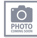
107T73 Clavijas de repuesto para disco de día para las series T8800 y R8800