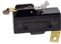
133T700A Microinterruptor para las series T8800 y R8800