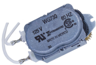
WG730-14DMX Motor de 125 V CA, 60 Hz para las series R8800, T1900, T1970 y T8800