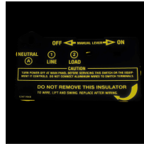
124T1948 Aislante para temporizador de un polo (T101, T102, T171, T172)