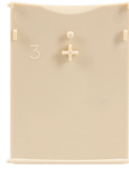
6ST3056 Puerta de repuesto ST01 color marfil