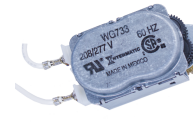
WG733-14D Motor de 208-277 V CA, 60 Hz para las series R8800, T1900, T1970 y T8800