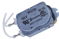
WG730-14D Motor de 125 V CA, 60 Hz para las series R8800, T1900, T1970 y T8800