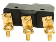
133T701A Interruptor de resorte de repuesto para las series T1900 y T2000