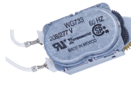
WG733-14D Motor de 208-277 V CA, 60 Hz para las series R8800, T1900, T1970 y T8800