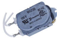
WG730-14DMX Motor de 125 V CA, 60 Hz para las series R8800, T1900, T1970 y T8800