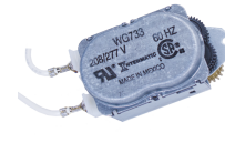
WG733-14DMX Motor de 208-277 V CA, 60 Hz para las series R8800, T1900, T1970 y T8800