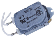
WG730-14D Motor de 125 V CA, 60 Hz para las series R8800, T1900, T1970 y T8800