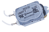
WG733-14D Motor de 208-277 V CA, 60 Hz para las series R8800, T1900, T1970 y T8800