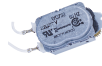
WG733-14DMX Motor de 208-277 V CA, 60 Hz para las series R8800, T1900, T1970 y T8800