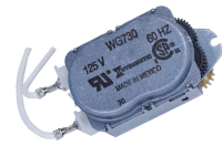
WG730-14DMX Motor de 125 V CA, 60 Hz para las series R8800, T1900, T1970 y T8800