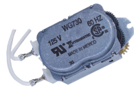
WG730-14D Motor de 125 V CA, 60 Hz para las series R8800, T1900, T1970 y T8800