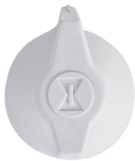
146MT577 Perilla para la serie FF: blanca