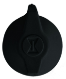
146MT579 Perilla para la serie FF: negra